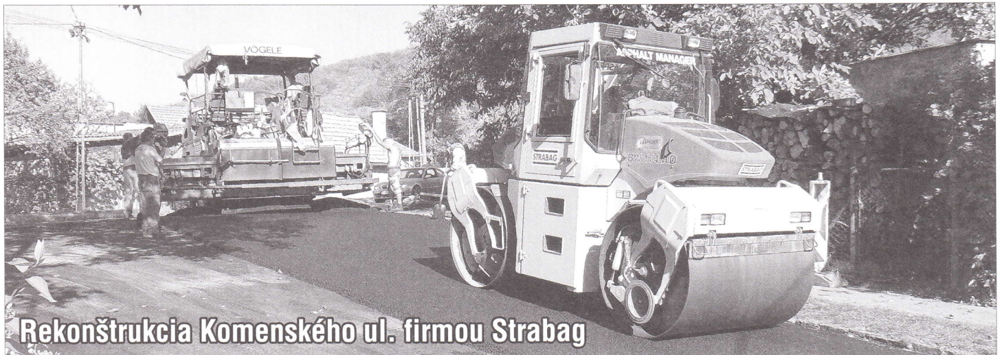
Rekonštrukcia Komenského ul. firmou Strabag