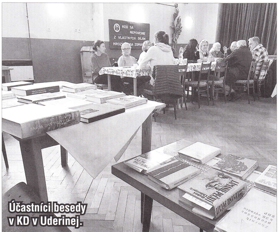
Účastníci besedy v KD v Uderinej.